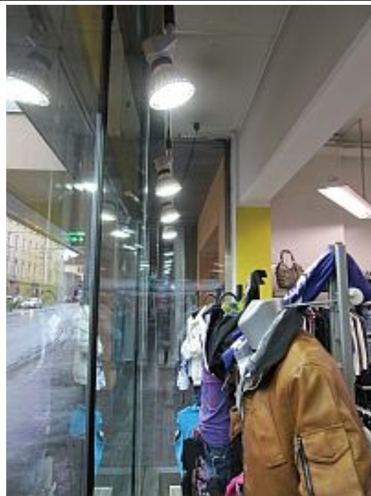
LED Technik / Reflector PAR48 22W kaltweiss mit Diffusor